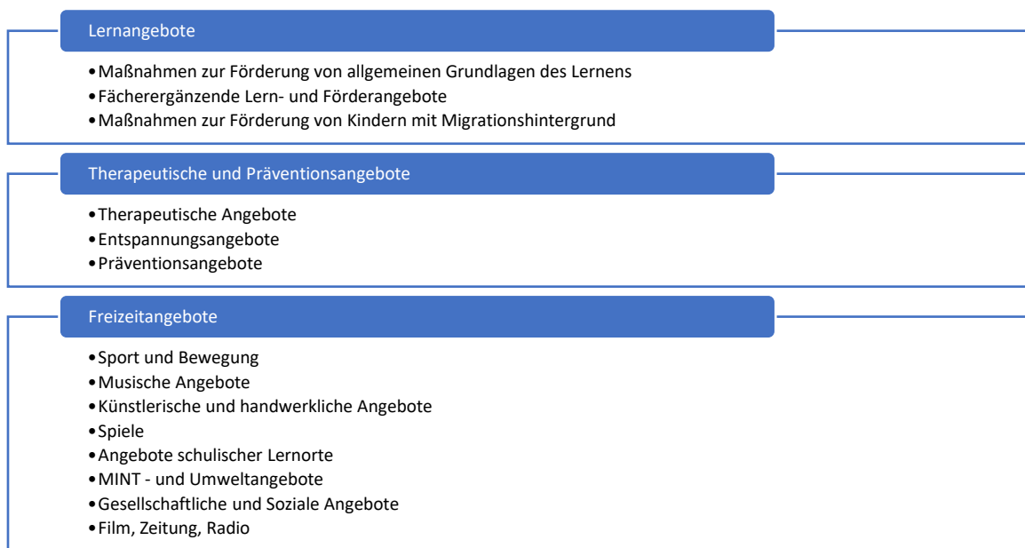
Abb. 1: Verteilung der drei Hauptkategorien und 14 Unterkategorien, welche die Inhaltskategorien ordnen.

Die FABeIF GTA-Statistik ermöglicht tiefere Einblicke auf die Ausgestaltung der Ganztagsangebote (GTA) in Sachsen. Schulen und kommunale Schulträger benutzen FABeIF für die Durchführung von Verwaltungsaufgaben im Laufe eines Schuljahres, weshalb das Programm die GTAs in den nutzenden Schulen detailliert abbilden kann. Diese Abbildungsleistung wird durch die GTA-Statistik verstärkt, da für jedes angelegte GTA in FABeIF zusätzlich eine inhaltliche Zuordnung eingeführt wurde. Die Zuordnung verwendet ein Kategorienapparat, welcher über ein dreistufiges Ordnungssystem funktioniert, in welchem jedes Angebot ein Inhaltslabel aus einer Auswahlmöglichkeit von 94 Inhaltskategorien zugeordnet wird. Diese 94 Label gruppieren sich in 14 Unterkategorien, welche sich wiederum in drei Hauptkategorien aufteilen.